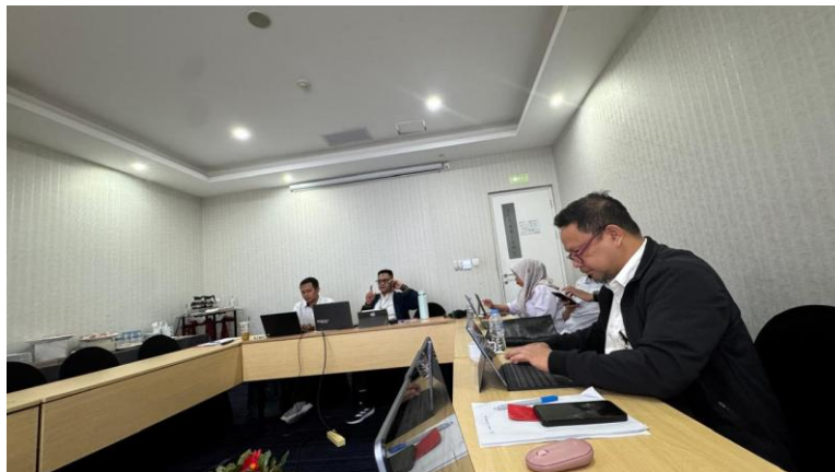
Gambar 3.22 Verifikasi Rancangan Akhir Renstra PD Tahun 2025-2029

Kegiatan ini mendukung komponen Perencanaan Kinerja dalam penilaian AKIP, khususnya dalam memastikan keselarasan sasaran, indikator, dan target kinerja dengan dokumen perencanaan pembangunan daerah serta prinsip cascading kinerja.