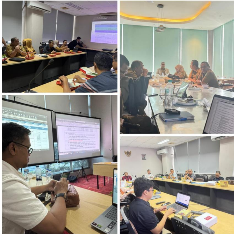
Gambar 3.23 Monitoring dan Evaluasi Kinerja Triwulan I-IV Tahun 2025