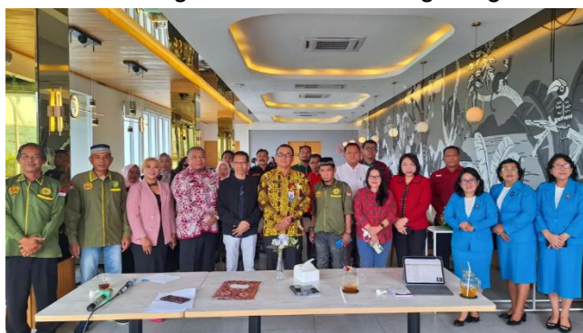
Gambar 3.7 Kegiatan Coffee Morning dengan Ormas

Kinerja program pemberdayaan dan pengawasan organisasi kemasyarakatan pada tahun 2025 didasarkan atas capaian indikator kinerja persentase organisasi masyarakat yang terdaftar dan aktif. Persentase capaian indikator kinerja ini adalah sebesar 100,36%. Program pemberdayaan dan pengawasan organisasi kemasyarakatan diwujudkan melalui pelaksanaan kegiatan coffee morning dengan ormas sebanyak 6 kali, kegiatan pembinaan dan pemberdayaan dalam rangka menuju tata pengelolaan organisasi yang baik sebanyak 3 kali, kegiatan fasilitasi rapat monitoring penanganan ormas terafiliasi premanisme yang mengganggu stabilitas keamanan dan investasi di Provinsi Kalimantan Timur sebanyak 1 kali, kegiatan peningkatan kapasitas aparatur perangkat daerah pada Kab/Kota yang menangani Subbidang Ormas sebanyak 2 kali, fasilitasi kegiatan Ngobrol Anti Korupsi (Ngopi) di Provinsi Kaltim sebanyak 1 kali, verifikasi data ormas se-kaltim sebanyak 2 kali, kegiatan podcast/talkshow dengan ormas sebanyak 3 kali, dan kegiatan Dialog dan Silaturahmi Ormas Keagamaan sebanyak 1 kali.