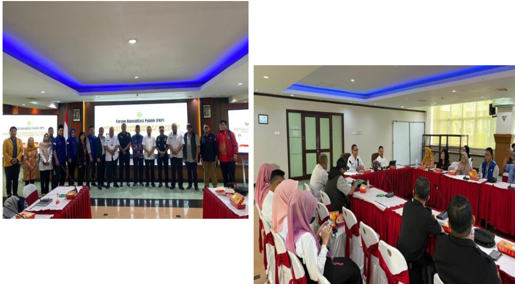
Gambar 3.21 Kegiatan Forum Konsultasi Publik Tahun 2025

yang ada pada Badan Kesatuan Bangsa dan Politik Provinsi Kalimantan Timur.