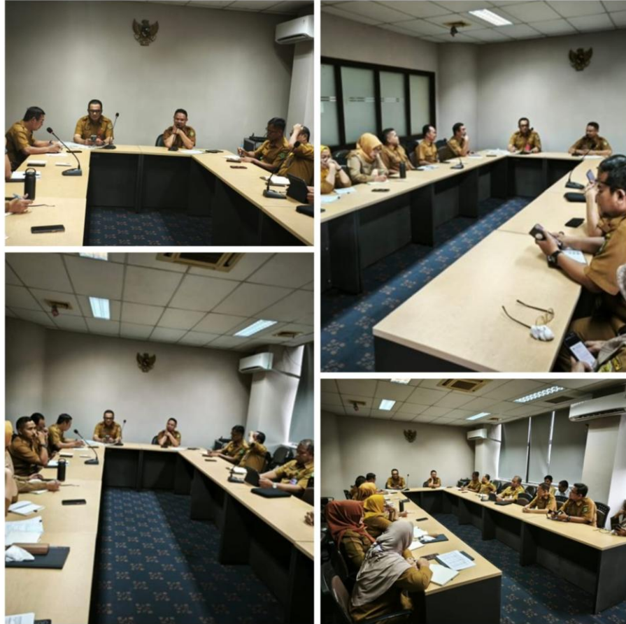
Gambar 3.24 Rapat Pembahasan Penyusunan dan Reviu Laporan Kinerja (LKJIP) Tahun 2025 sebagai bagian dari pemenuhan komponen Pelaporan Kinerja