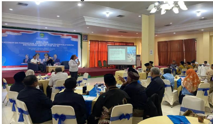
Gambar 3.15 Kegiatan Rapat Tim Terpadu Percepatan Rehabilitasi Bagi Pecandu dan Penyalahgunaan Narkotika Wilayah Kaltim