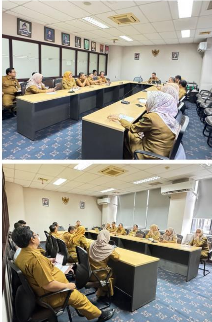
Gambar 3.25 Rapat Reviu Internal atas Implementasi SAKIP