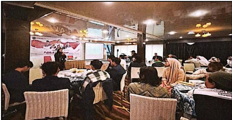
Gambar 3.1 Kegiatan Sosialiasi Pendidikan Politik

Capaian kinerja Program Peningkatan Peran Partai Politik Dan Lembaga Pendidikan Melalui Pendidikan Politik Dan Pengembangan Etika Serta Budaya Politik pada Tahun 2025 mencapai sebesar 115,91%. Capaian persentase masyarakat yang mendapatkan pendidikan politik dan pengembangan etika serta budaya politik diwujudkan melalui pelaksanaan kegiatan sosialisasi pendidikan politik sebanyak 5 kali, kegiatan FGD Indeks Demokrasi Indonesia (IDI) sebanyak 1 kali, kegiatan Rapat Tim Pokja Indeks Demokrasi Indonesia sebanyak 3 kali, kegiatan Penguatan Lembaga Demokrasi sebanyak 1 kali, kegiatan Rapat Tim Pemantauan Perkembangan Politik di Daerah (TP3D) sebanyak 3 kali, kegiatan coffe morning dengan partai politik sebanyak 2 kali.